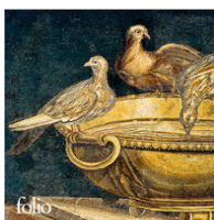
Marguerite Yourcenar Mémoires d'Hadrien