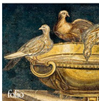
Marguerite Yourcenar Mémoires d'Hadrien